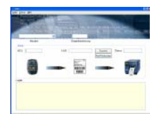
Faßerkennungssystem für eine große Kölner Brauerei